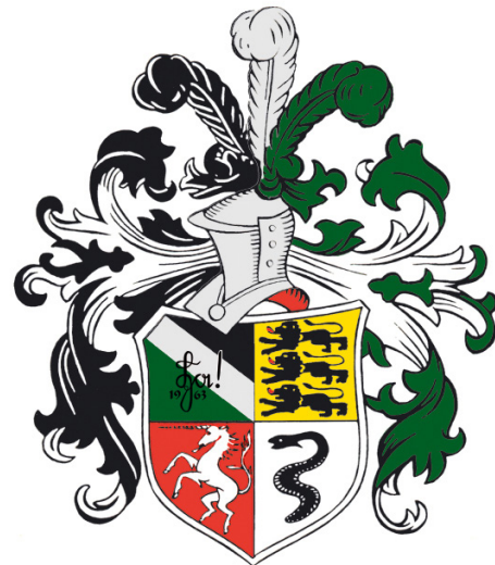
Programm zum Wintersemester 2021/2022

Freie technische Verbindung Hohenstaufen zu Aalen