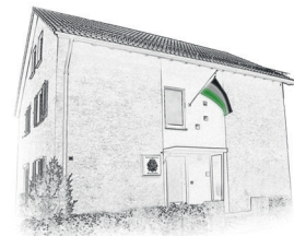
Hohenstaufenhaus Mozartstraße 31, Aalen

Wir organisieren eine Vielzahl von Veranstaltungen, egal ob es Feste, Fachvorträge oder gemeinsame Ausflüge sind. Nicht nur traditionelle studentische Feste und gemeinsames Beisammensein werden bei uns ausgerichtet, sondern auch fächerübergreifende Kompetenzen werden groß geschrieben.